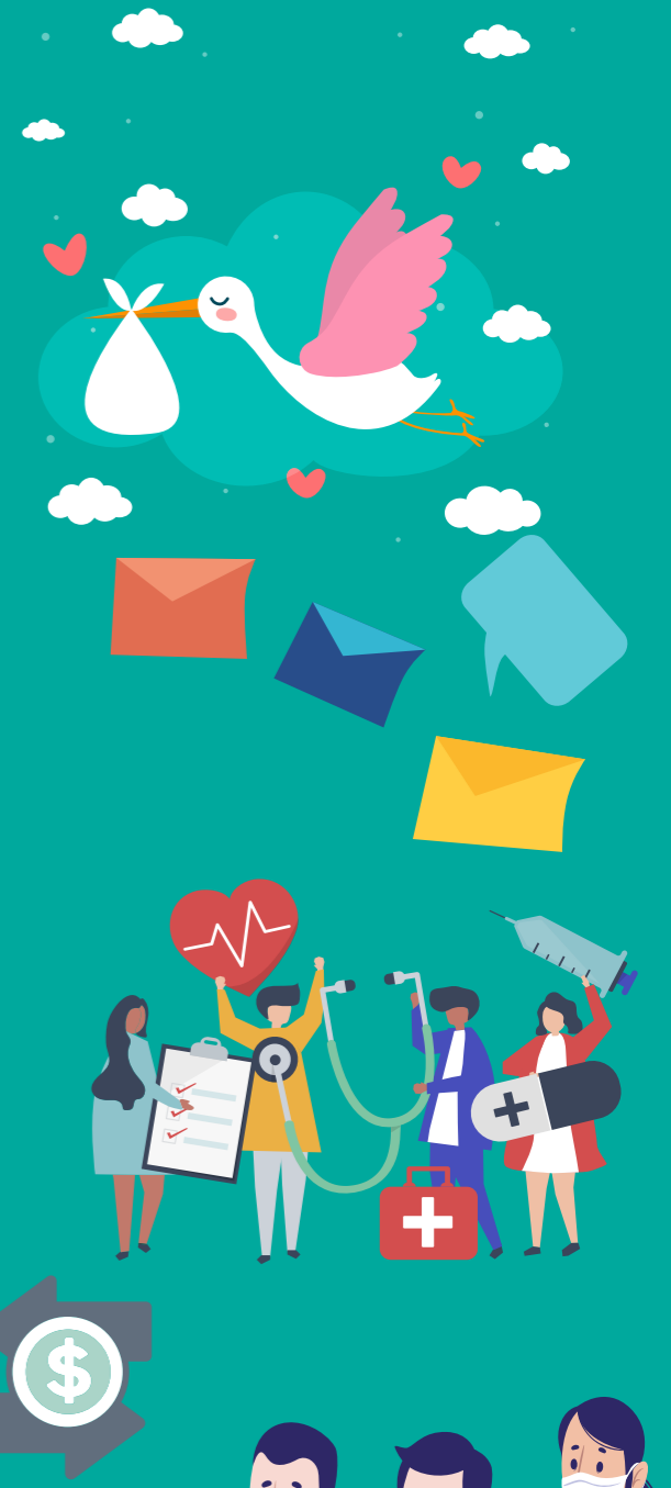
TABLA DE BENEFICIOS BIENESTAR 2025